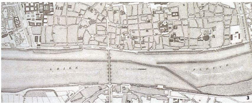
3. Plan de la ville d'Orléans et de ses faubourgs, Fournier, 1876

Au 18 e siècle, les quais allant du port de la Tour-Neuve jusqu'au port de Recouvrance deviennent insuffisants. L'ensemble des berges est alors repris, tout d'abord à l'aval (actuel quai Barentin), puis à l'amont (actuel quai du Châtelet) ; un quai pavé à forte pente constitue désormais le trait de berge. La continuité entre port d'aval et port d'amont est réalisée, dans un premier temps de façon provisoire, à la fin du 18 e siècle, puis de manière pérenne au début du 19 e siècle.