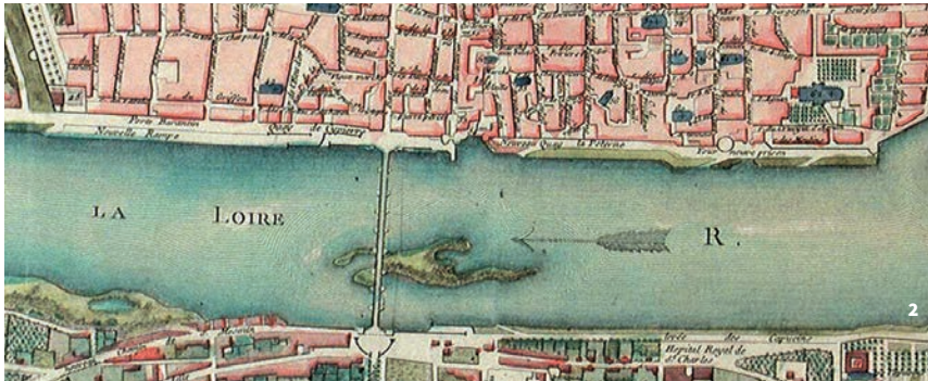
2. Nouveau plan d'Orléans augmenté de ses faubourgs, A.-M. de Cypierre, 1777