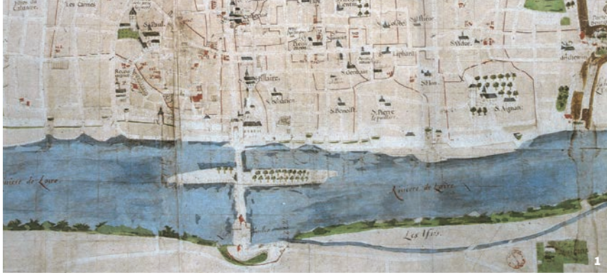
1. Plan de la ville d'Orléans, J. Fleury, 1640